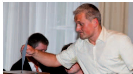
Untrügliche Körpersprache: Misstrauen trotz gegenteiliger Absichtserklärung