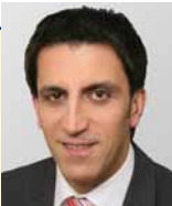
Bürgermeister Erwin Bernreiter Gemeindeparteibmann